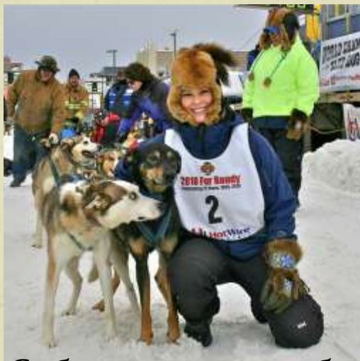
Собачьи и оленьи бега