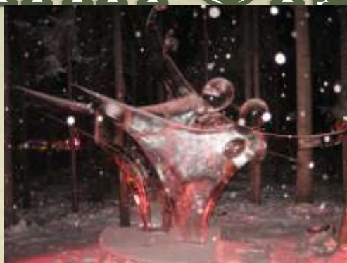
Всемирный чемпионат скульптур из льда