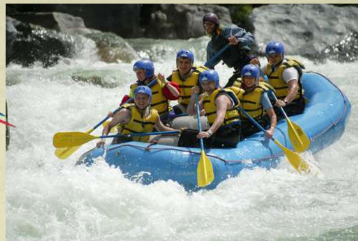
Сплавление по горным рекам